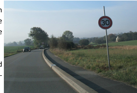
La piste partagée a été prolongée jusqu'à la limite communale

Les deux chicanes permettent de limiter considérablement la vitesse à l'entrée de la zone urbanisée de la commune.