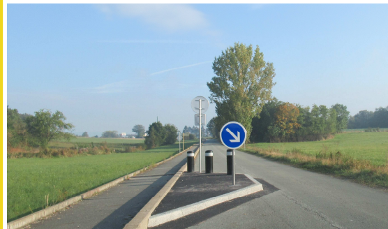
Deux chicanes pour réduire la vitesse et empêcher la circulation des poids lourds

La chicane la plus étroite a été réalisée afin de bloquer le passage des poids lourds. L'ancien rétrécissement avait, en effet, été écarté et permettait le franchissement par les plus de 3,5 tonnes. Rappelons que la structure de cette voirie communale ne permet pas la circulation de ce type de véhicule. Ne pas rendre effective l'interdiction qui résulte de cet état de fait reviendrait à accepter la réfection de cette voie tous les 10 ou 15 ans au frais de la commune.