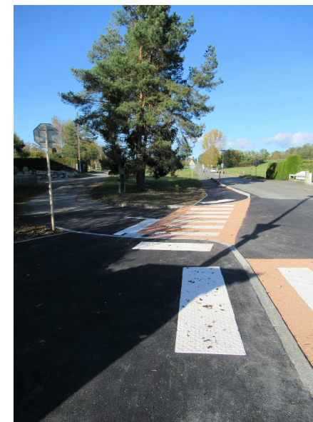
La piste partagée a été complétée et sécurisée vers le carrefour de la Balance

Enfin, un dispositif d'éclairage LED alimenté par panneau solaire permet de sécuriser la voie partagée tout en éclairant les chicanes.